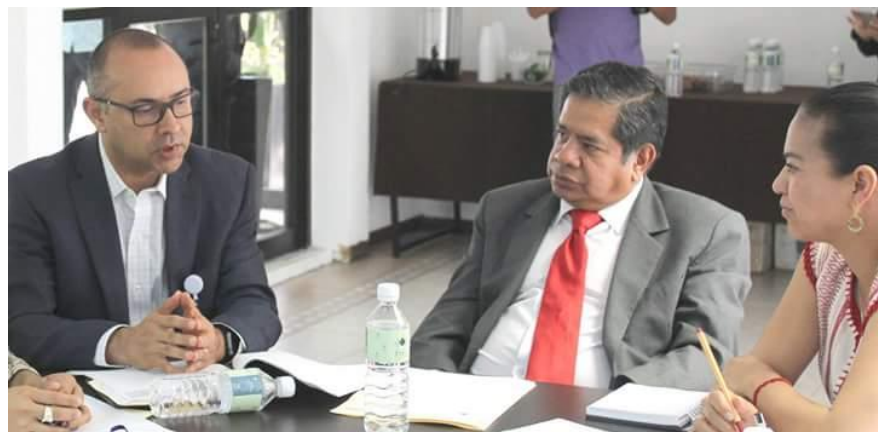
Reunión de trabajo integrantes permanentes SMO, IEEPCO y TEEO, 12 julio 2017.