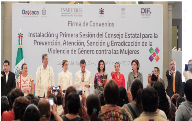
Firma de convenio del Observatorio de Participación Política de las Mujeres en el Estado de Oaxaca. 03 Marzo 2017.

El presente Plan de Trabajo del Observatorio de Participación Política de las Mujeres en el Estado de Oaxaca tiene como finalidad definir las tareas y objetivos del mismo, que representa un espacio abierto para la difusión de información en materia de derechos político electorales de las mujeres oaxaqueñas.